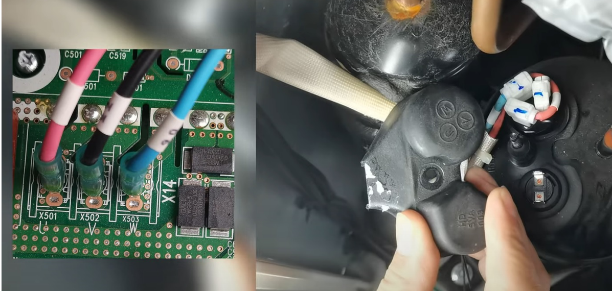
Ispravan spoj kompresora

Ako je vaš odgovor DA - idite na pitanje 5.